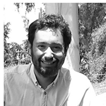
Ricardo Riveros, President IFLA Americas

Ricardo Riveros, presidente de la International Federation of Landscape Architects IFLA, región Américas.