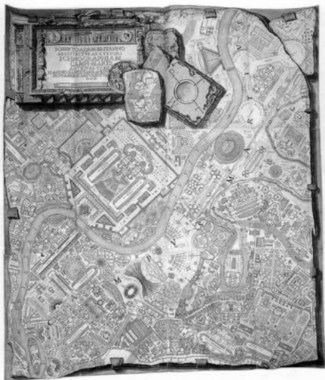
Figura 7. Piranesi, Campo Marzio de la Antigua Roma (1762).

Si toda reconstrucción requiere un salto imaginativo, en el caso de Piranesi la búsqueda de cómo era el pasado le llevó a vislumbrar estructuras y procesos que no podían reconstruirse, porque no eran o no podían sobrevivir como procesos. En efecto, solo a través de la imaginación se puede revivir el pasado. Cuando Freud se vuelve hacia la Roma imaginada por los humanistas, comenta que comprende perfectamente el entrelazamiento de pintura y actualidad implícito en el trabajo de imaginación y reconstrucción (Focillon, 2018).