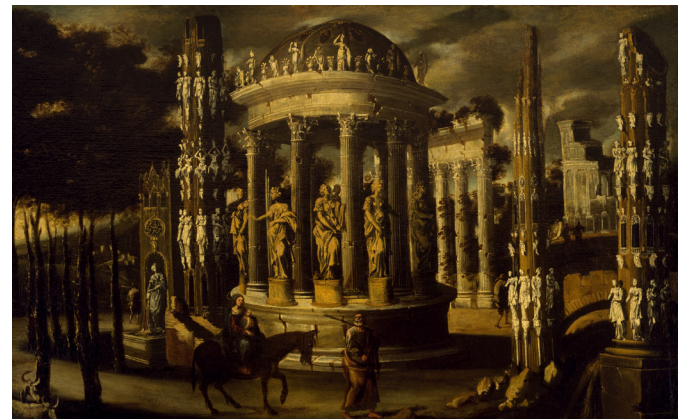
Figuras 3 Giulio Romano, Lapidación de San Esteban (Det.) 1521. François De Nomé, Fuga a Egipto

El trasfondo de un episodio reciente o, más a menudo, remoto, podía ser ficticio o realista para la composición pictórica o, más a menudo aún, el resultado se componía de elementos fantásticos y reales fundidos para formar una nueva realidad.