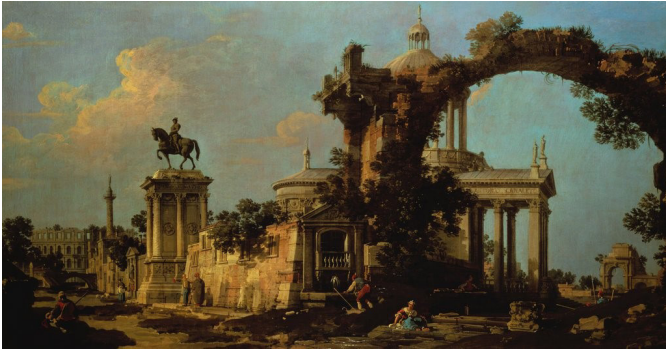
Figura 5. Canaletto, Capriccio de Ruinas romanas con una iglesia abovedada y el monumento Colleoni (1754).