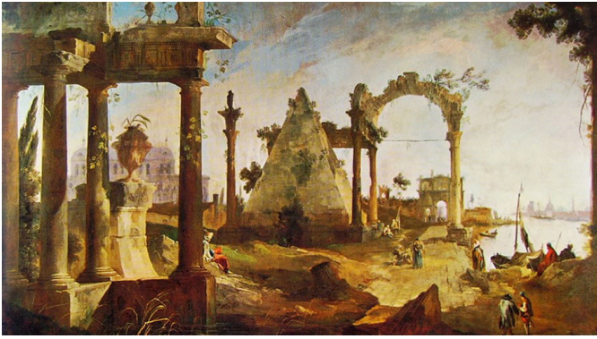
Figura 4. Canaletto, Capriccio con Ruinas clásicas (1723).