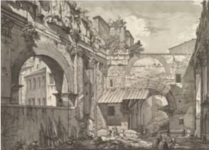
Figura 8 Piranesi, Vista interior del Atrio del Pórtico de Octavia (1760).

sombras contrastadas, cada rincón de la majestuosa arquitectura reelaborada.