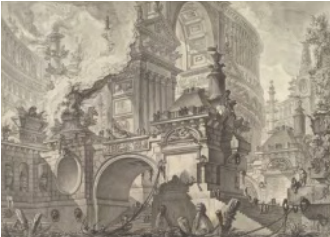
Figura 9 Piranesi, Parte de un magnífico puerto utilizado por los antiguos romanos (1750).

Los edificios y espacios se dibujan con una perspectiva central o incidental, de modo que los elementos fundamentales de este método de representación son siempre fácilmente identificables. Piranesi consigue así un extraordinario efecto de dilatación del espacio arquitectónico: la representación ligeramente reducida más allá de una abertura, el arco de un puente o un grupo de columnas da la ilusión de que los objetos representados se encuentran a gran distancia del espectador (Zerbi, 2014).