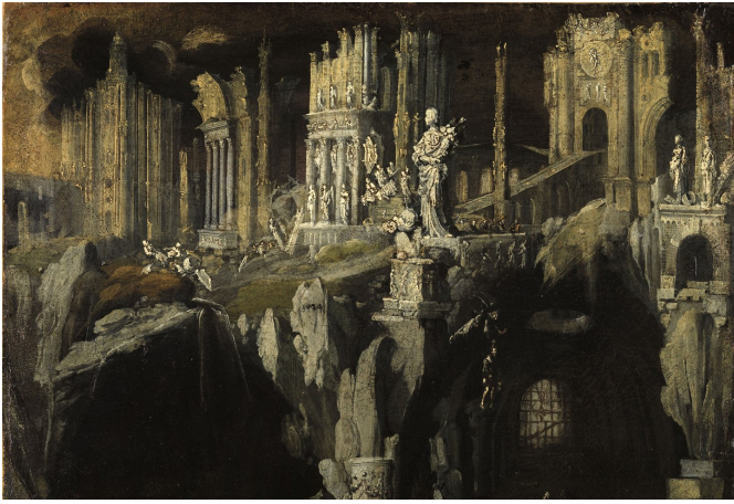
Figura 1 François De Nomé, Daniel en el foso de los leones (1624).