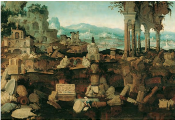
Figura 2 Herman Posthumus, Paisaje con ruinas romanas (1536).

Los dibujos y pinturas del siglo XVI que representan ruinas, muy a menudo de Roma, se han interpretado como pruebas de la grandeza pasada y, al mismo tiempo, como signos de una ineluctable decadencia (Mendoza, 2005). Así, los pintores flamencos lo demuestran combinando planos naturales con la recreación de nuevos edificios fantásticos, como en el caso de la Destrucción del Templo de Jerusalén (Clades Judæ Gentis, grabado por Philips Galle, 1569) de Marteen Van Heemskerck (1535-36), donde combina fantásticamente el Panteón de Agripa y la Basílica de San Pedro (entonces en construcción). Paisajes con ruinas semi-fantásticas se encuentran también en Paisaje con el rapto de Helena, del mismo pintor holandés.