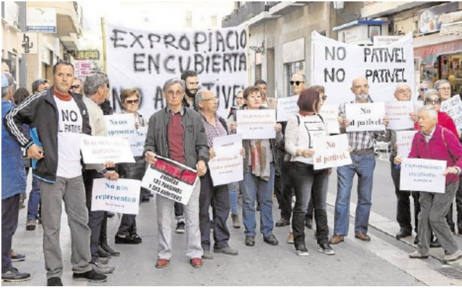
Figura 2: Manifestación de vecinos contra el PATIVEL (Torres, 2021). Nota. Fotografía de Damián Torres, publicada en Las Provincias el 22 de febrero de 2021.

El análisis de estos casos nos permite identificar varios factores críticos: