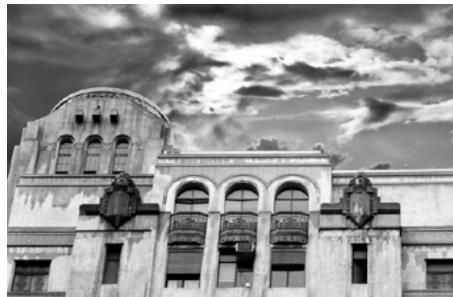
Fig. 4 La Torre de la Caja del Seguro Obrero Obligatorio y Empleados Particulares (actual Ministerio de Justicia) quedó terminada en 1931.(Detalle).

grupo familiar, para conceder dicho beneficio 23 . A nuestro juicio, la importancia de dicho requisito radica en la necesidad de arraigar y crear o mantener un vínculo e pertenencia de la familia asignataria con el entorno más inmediato: el barrio. Por otro lado, reducir o minimizar los tiempos de viaje entre el trabajo y la casa y viceversa.