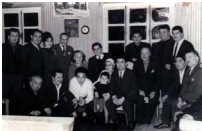
Fig. 3 Reunión de Empleados Particulares.

más de las Cajas de Empleados que existieron en la época. “Así a mediados de los 50, el sistema de pensiones se caracterizaba por la convivencia de una multiplicidad de regímenes (150) y por la atomización institucional (35 cajas). Pese a los intentos por uniformar regímenes y eliminar los privilegios de algunos grupos durante los gobiernos de Eduardo Frei y Salvador Allende, no se logró el consenso necesario porque las presiones corporativas bloquearon dichas iniciativas” 21 . De esta manera ya surgían críticas al antiguo sistema de capitalización colectiva vía Cajas de Empleados, entre otras cosas, porque no alcanzaba a cubrir a la gran masa trabajadora chilena: