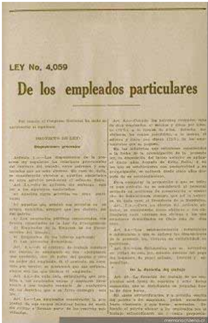
Fig. 2

y grupos en aquellas esferas en las que de acuerdo con determinados criterios les correspondía intervenir” 7 Para llevar a cabo dicha política pública se creó la Consejería Nacional de la Promoción Popular, la cual enfocaba su acción desde tres aspectos de la realidad nacional: