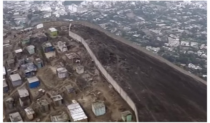
Fig 5. El muro de la vergüenza, Lima, Perú.

No obstante, a pesar de su reconocimiento y de su capacidad de visibilizar las desigualdades de la fragmentación urbana, imágenes similares se repiten bajo los mismos parámetros de desigualdad en otras ciudades latinoamericanas. En el distrito de Santa Fe [Fig.4], uno de los más ricos de Ciudad de México, puede verse el contraste entre las espléndidas casas en amplios espacios ajardinados de la ciudad formal y el amontonamiento de las casas autoconstruidas, la mayoría sin servicios mínimos y casi sin espacio para moverse. El valor arquitectónico de la secuencia fotográfica, alude sin embargo a los límites entre ambas ciudades, la formal y la informal, mostrando las múltiples posibilidades urbanas de segregación entre ambos estratos. Así, mientras en algunos casos se muestra una separación similar a la de Paraisópolis, donde un muro separa ambos mundos, colmantándose en la zona pobre y con cierta distancia de la zona rica, en otros casos el contacto físico es total, y el 'muro' solo aparece en los espacios libres mientras que en la parte construida se trata de medianeras que de un lado sirven a la ciudad rica y de otro a la ciudad pobre. La situación manifiesta una tensión evidente entre ambos extremos, generando una sensación de que en algún momento una de las