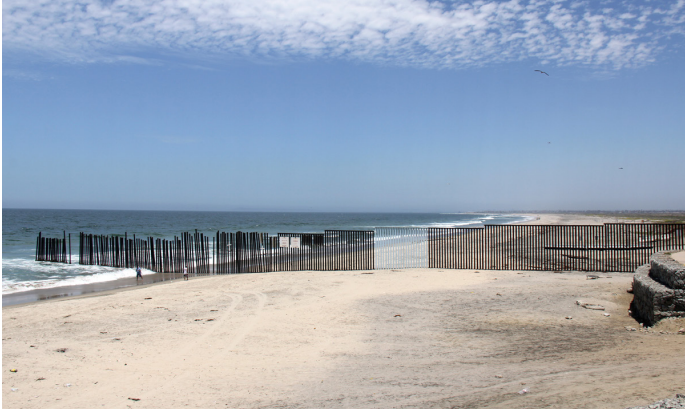
Fig. 6 y 7. Borrando la frontera: Erasing the border, Ana Teresa Fernández.