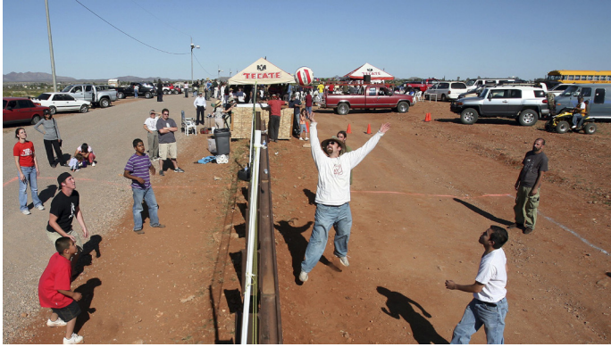
Fig.1. Wallyball: Jugando Volleyball en la frontera.