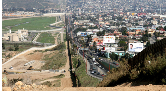
Fig. 2. 'Ciudad Dual' en la frontera entre Tijuana (México) y San Diego (EE.UU.).

En este ámbito, donde nuevas formas de apertura para unos suponen tensiones y restricciones para otros, también se ubica la construcción del puente entre la ciudad argentina de Posadas y la paraguaya de Encarnación. El incremento en la movilización de personas y mercancías ha acabado por convertir el celebrado viaducto, concebido como símbolo de integración, en un escenario de conflictos sociales. A través del puente, los posadeños acudían a comprar en Encarnación y las tradicionales 'paseras' paraguayas mantenían la pequeña mercadería de la frontera. Sin embargo, el control sobre la frontera se intensificó, ante las protestas tanto de algunas organizaciones de Posadas, que veían cómo el dinero argentino salía por el puente, como por el exceso de la economía informal al otro lado de la frontera, provocando bloqueos del puente por parte de 'paseras' y taxistas paraguayos que reclamaban su flexibilización. Este caso expone claramente la relación entre frontera y movilidad como elementos indisolubles. Si la frontera es fija e inmovilizante, produce discontinuidades, sirviendo únicamente como elemento delimitador y de control que dificulta el intercambio entre los lados y agrava el deseo de traspasarlo ilegalmente.