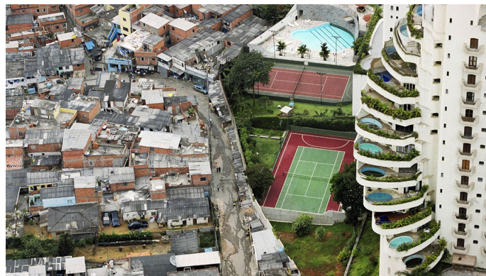
Fig. 3. Favela Paraisópolis, Sao Paulo, Brasil. Autor: Tuca Vieira. Fuente: http://www.tucavieira.com.br/

Las condiciones de límite que se dan en el territorio se reproducen de forma análoga en el interior de las ciudades a modo de dualidad urbana. Como fenómeno directamente asociado a la globalización, la dualidad urbana hace referencia a una polarización social y económica de la sociedad y a su repercusión en el espacio urbano de las grandes ciudades, manifestándose como el triunfo definitivo del capitalismo como estructura urbana e instalando en las ciudades una lógica de desigualdad social e injusticia urbana. Es, por tanto, un sistema urbano social y espacialmente polarizado entre: los grupos altos (que toman las decisiones y ejercen las funciones) y los grupos sociales devaluados. La confluencia de ambas situaciones ha contribuido a la polarización social, representada a través del crecimiento de las clases alta y baja, y la disminución (y progresiva desaparición) de la clase media. Paradójicamente, la necesidad de trabajos de bajo nivel salarial es uno de los motores de la globalización. Así, el declive social se convierte en un valor de desarrollo en vez de en un síntoma de decadencia, como ocurría antes. La polaridad social que genera este modelo es necesaria para poder mantenerlo en funcionamiento; de tal forma, las personas que forman este estrato salarial: los encargados de la limpieza, la seguridad o las tareas domésticas,... son fundamentales para garantizar el