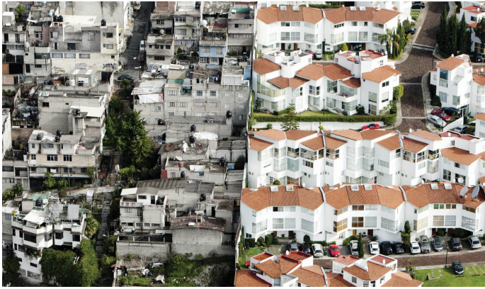
Fig 4. Distrito de Santa Fe, México D.F. Autor: Oscar Ruiz. Fuente: http://www.plataformaarquitectura.cl/cl/623902/fotografia-de-arquitectura-mundos-aislados-segregacion-urbana-y-desigualdad-en-santa-fe

y la ilegal, donde en el mismo espacio urbano se enfrentan la exclusión y el desamparo de unos frente a los privilegios de otros.