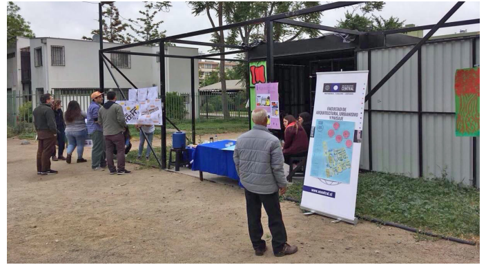
Jornada de validación con los vecinos/as, 4 de noviembre 2017.

premisa, la facilidad de entendimiento desde los vecinos/as, además de permitirles seguir trabajando en forma autónoma las problemáticas con las instituciones pertinentes.