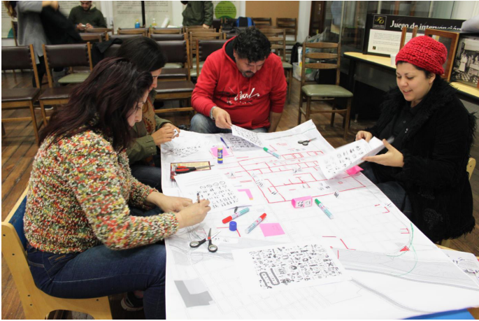
Vecinos/as del Barrio Yungay en jornada de Mapeo, junio 2016, Museo de la Educación Gabriela Mistral

Entre abril de 2016 y agosto de 2017 se desarrolló todo el proceso del Mapeo Colectivo en Barrio Yungay y el trabajo de la Clínica con la comunidad barrial, procurando buscar un espacio de encuentro y trabajo colaborativo con este tradicional sector del centro capitalino. Resultado de aquello fue la elaboración de una cartografía que, desde una perspectiva vecinal, muestra los límites de ese territorio, aquellas emergencias que los afectan y los acontecimientos que dan lugar a manifestaciones colectivas emergentes.