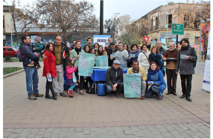
Entrega de la Cartografía en Plaza Yungay, 5 de agosto 2017

Desde el punto de vista del tiempo, cada uno de estos fenómenos puede involucrar una mayor permanencia, mientras que otros permiten una resolución en el mediano plazo. Entre los permanentes encontramos los sitios eriazos y vacíos, pero también el patrimonio en riesgo, en la medida en que