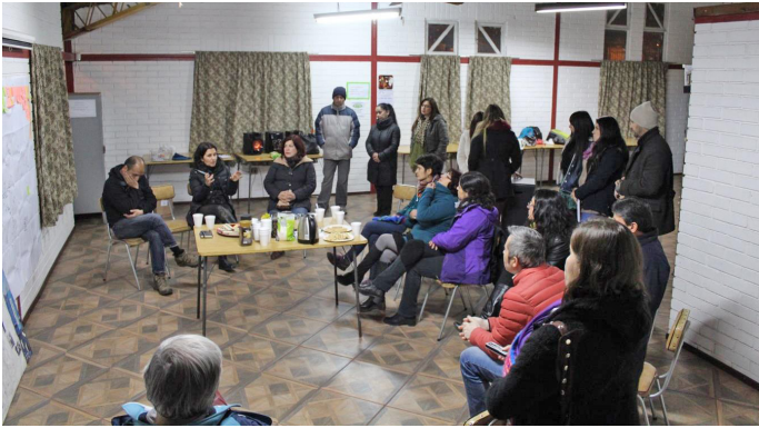
Jornada de Mapeo en Villa Olímpica, 5 de julio 2017