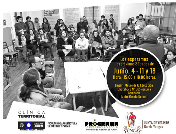
Afiche de convocatoria a los vecinos/as de Barrio Yungay, junio 2016

SÚMATE a la elaboración de un Mapa Territorial que estamos realizando en conjunto con estudiantes de la Universidad Central, para proteger y fomentar los valores patrimoniales de nuestro Barrio