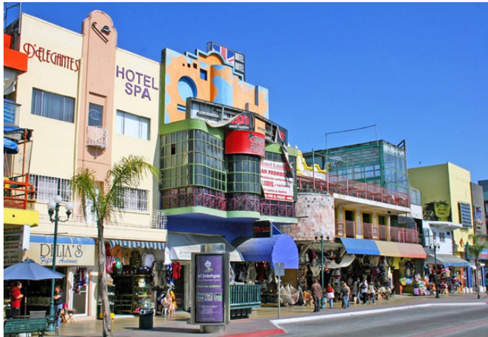
Imagen 19. Arquitectura y elementos decorativos. Avenida Revolución entre calle Quinta y Sexta, Tijuana, Baja California, México.

La avenida Revolución es dar la bienvenida al visitante de San Diego, algo así como una puerta de entrada donde de golpe puede percibirse todo lo que es la ciudad. Es un cúmulo de símbolos posmodernos y cambiantes sobre la otredad, así como la reminiscencia de lo propio.