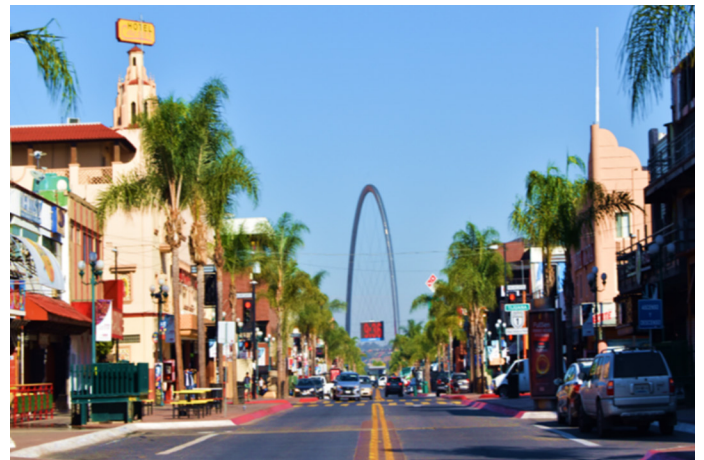
Imagen 1. Avenida Revolución de sur a norte en el año 2021

La avenida sobre la que trata este artículo lleva sobre sí gran parte de la historia de la ciudad, y el origen de esta. Representa para los tijuaneños la raíz de su cultura e identidad. Por ella han pasado los fundadores de la ciudad dedicados al comercio interfrontera, la burocracia aduanal, artistas de Hollywood, empresarios, bandidos y todo tipo de visitantes y migrantes. Este punto fronterizo ha sido testigo de fenómenos tales como el nacimiento y crecimiento de una ciudad con problemas sociales como el narcotráfico y la migración extrema. Por esto mismo, se ha conjugado una gama tan variada de actividades y elementos visuales relacionados con las políticas migratorias y el arte, así que no ha dejado de ser un espacio de atracción para extranjeros y nacionales desde comienzos del siglo XX.