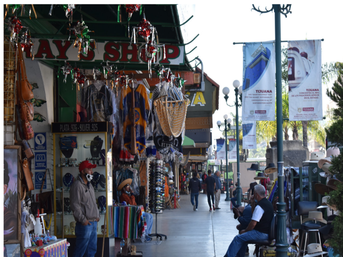
Imagen 20. Foto de recorrido y observación de campo. Avenida Revolución a la altura de calle Segunda.