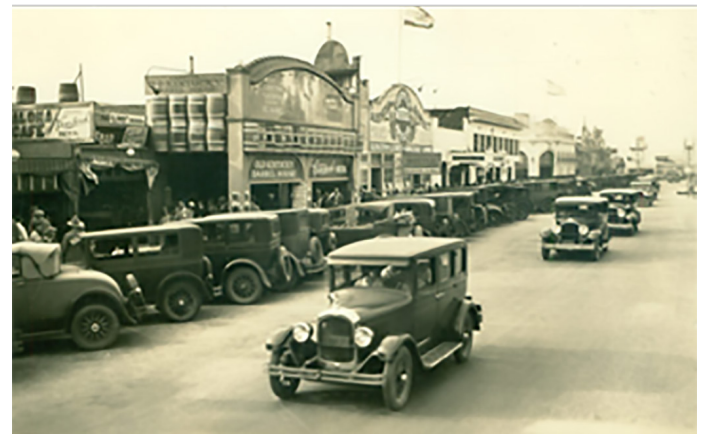
Imagen 13. Avenida Olvera, posteriormente "A" y finalmente Revolución, en Tijuana hacia 1920.

A raíz de la ola moralista desatada en San Francisco después del temblor de 1911, se prohíben en California las cantinas y carreras de caballos, lo que da lugar a estas actividades del lado mexicano, aumentando el cruce de visitantes a Tijuana. El lado poniente de la avenida Olvera (o Revolución) se llenó de negocios dedicados a las diversiones (Morales y García, 1995).