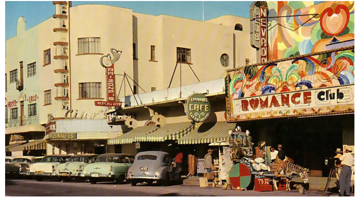
Imagen 5. Vista de la Avenida Revolución en los años cincuenta.

Como es posible observar, en el caso de Tijuana, la actividad turística no solo funge como agente de desarrollo, sino que es la razón primaria para la existencia del lugar. Como mencionan Casas et al., “el término vocación se define por el carácter propio con el que se propone un lugar determinado, ya sea por sus características geográficas y por los intereses con el que es concebido” (2017, p. 75), de modo que tanto la ubicación geográfica en situación de frontera y vía de paso, como los primeros motivos en torno a la satisfacción recreacional y comercial, permiten visualizar una vocación que ha sido fuertemente marcada por la actividad turística.