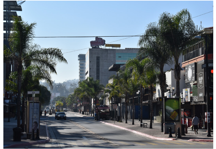
Imagen 21. Foto de recorrido y observación de campo. Avenida Revolución dirección norte a sur.