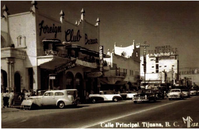
Imagen 14. Foreign Club sobre Avenida Revolución hacia los inicios de los años treinta.

Ante la derogación de la Ley Seca en 1933, cerrarían sus puertas los negocios aledaños al Foreign Club (Murrieta y Hernández, 1991, p. 31). El panorama se agrava cuando, en 1935, Lázaro Cárdenas decreta el cierre de todas las casas de juego del país. Esto llevó al cierre del Casino Agua Caliente y la consecuente pérdida de empleos a nivel general, lo que sería contrarrestado con el desarrollo de nuevas estrategias de comercio como la venta de curiosidades y la creación de la zona libre en 1937 (Morales y García, 1995, p. 22).