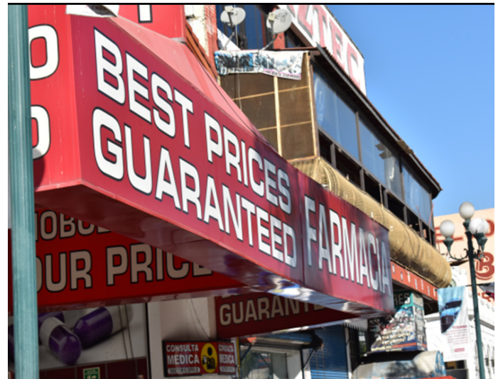
Imagen 10. Anuncios comerciales en Avenida Revolución.

Los estudios del paisaje realizados “desde una dimensión visual, permiten convertir la percepción en un dato preciso, caracterizado por el valor cualitativo del espacio, capaz de describir, clasificar y valorar el paisaje” (Pedraza, 2019, p. 64). Un ejemplo de esto es el estudio que realizaron Venturi, Scott Brown e Izenour (1972) sobre el Strip de Las Vegas, en el que se da cuenta de la importancia que tienen los elementos visuales por su capacidad de comunicar y significar. Este tipo de trabajos permiten identificar cómo la arquitectura, a veces por los requerimientos espaciales de funcionalidad, cede protagonismo a los elementos decorativos, los cuales llegan a conformar ambientes en apariencia artificiales, donde el consumo es el eje sobre el cual se dan las transformaciones.