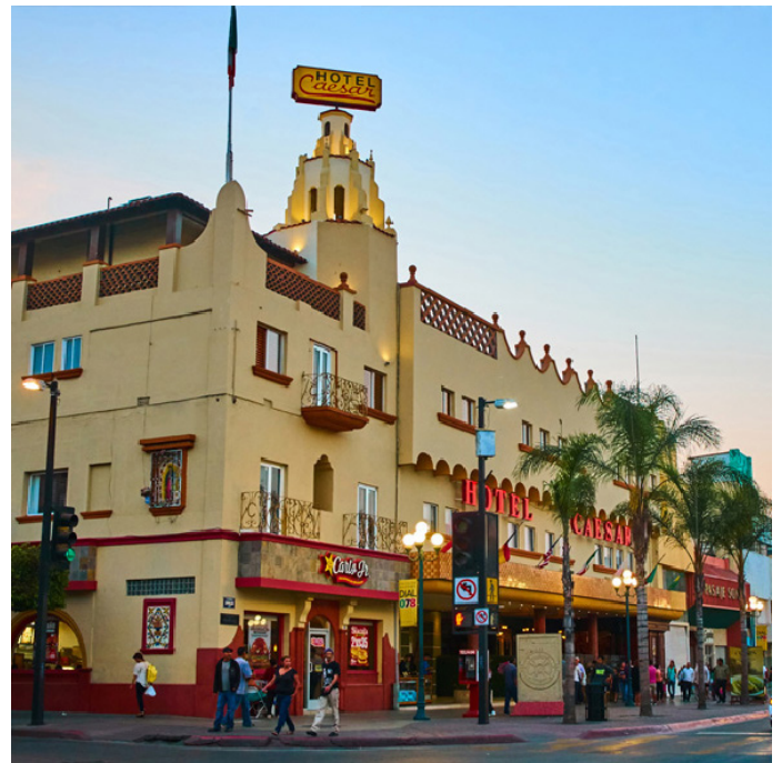
Imagen 7. Vista actual del Hotel Caesar's sobre Avenida Revolución y calle Segunda.