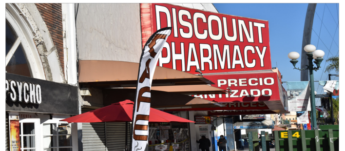
Imagen 11. Anuncios comerciales en Avenida Revolución.