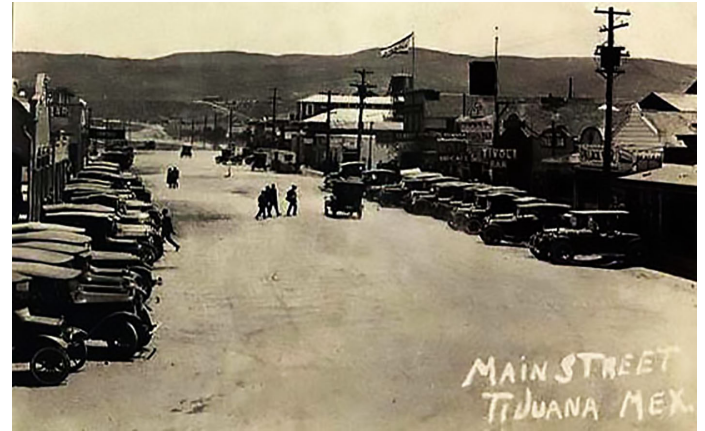
Imagen 12. Avenida Revolución (en sus inicios calle Olvera). Años veinte.

Para comprender la vocación turística de esta avenida, nos remontamos al año 1848, cuando a raíz de la guerra entre México y Estados Unidos se impondrían los nuevos límites territoriales, cambiando de carácter el lugar (Piñeira, 2019). Así, las actividades en cada uno de los poblados, Tijuana del lado mexicano y San Ysidro del lado estadounidense, estarían supeditados cada uno a sus economías nacionales. Ahora se consideraría al "otro lado" como un lugar a visitar en el que se tendría que cruzar por este tramo "en diligencias a caballo o en carros a la caza de conejos, codornices o a la compra de langosta, abulón o pescado que los pobladores de la costa comúnmente vendían" (Barrón, 1992, p. 197). La avenida Revolución, entonces llamada calle Olvera, comenzaría a ser uno de los ejes principales de tránsito hacia Tijuana y otras poblaciones como la playa de Rosarito o Ensenada.