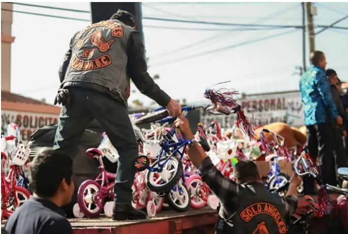
Imagen 18. Toy run, 12 de diciembre 2021.

Fiesta de Halloween: Se llevó a cabo en la avenida Revolución con un aforo de miles de ciudadanos y visitantes. Además de la verbenas populares en la calle, diversos bares ofrecieron fiestas de concursos (San Diego Red, 2021).