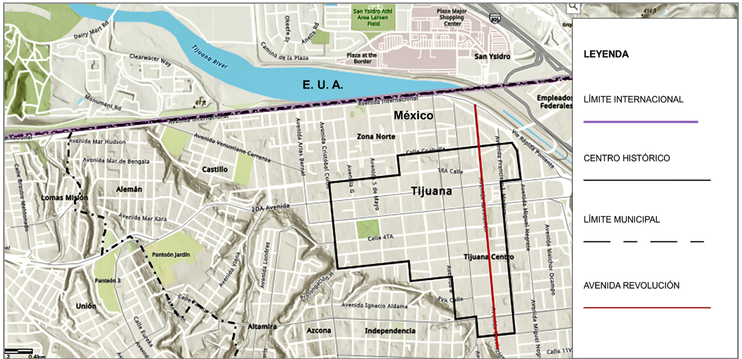
Imagen 3. Ubicación de la Avenida Revolución en el centro histórico de Tijuana. Frontera México- Estados Unidos.