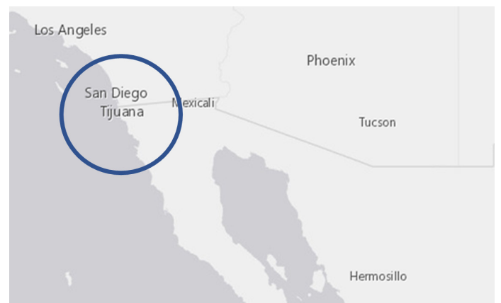
Imagen 2. Mapa de Ubicación de Tijuana en la frontera noroeste México-Estados Unidos