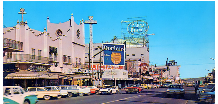
Imagen 6. Avenida Revolución en años sesenta. Fuente: Timetoast Timeline, 2022.