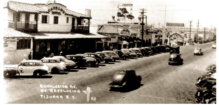
Imagen 15. Vista oeste de sur a norte. Avenida Revolución hacia los años cuarenta. Fuente: Postdata Tijuana, 2013.

Fuente: Elaboración propia con información de Piñeira (2019), Murrieta y Hernández (1991), Morales y García (1995), Vanderwood (2008) y Barrón (1992).