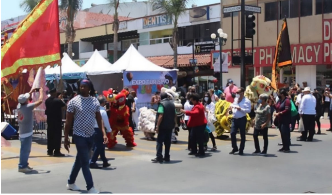
Imagen 17. Expo turismo Tijuana y Mega región. Avenida Revolución, 1 de julio 2021.

Expo turismo Tijuana y la Mega Región: Fue llevada a cabo en la Avenida Revolución “con el propósito de promocionar los atractivos y productos turísticos de Tijuana y toda la región del estado de Baja California y el sur de San Diego” (Estatal, 2021, p. 1). Contó con más de 60 expositores.