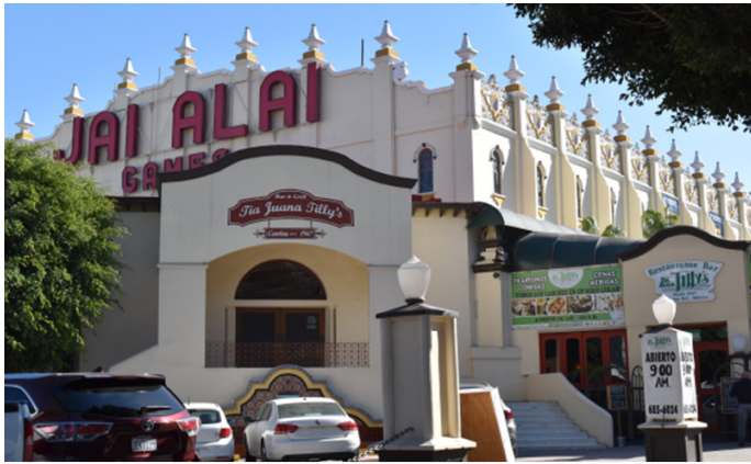
Imagen 8. Centro de espectáculos Jai, Alai, antes centro deportivo en calle Revolución.