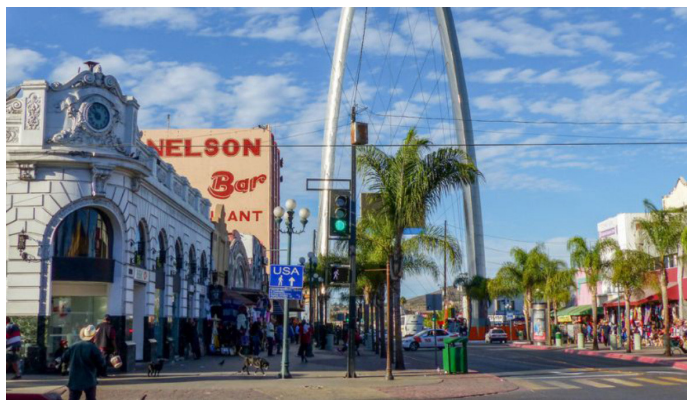
Imagen 4. Vista sur a norte de la Avenida Revolución desde la calle Segunda.

En la avenida Revolución se generan paisajes culturales disímiles y en apariencia inestables que le proporcionan una identidad muy cambiante. Éstos deben ser no solo descritos, sino observados, a fin de explicar las razones que dan sentido a su origen, permanencia y cambios.