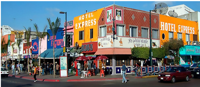
Imagen 9. Hotel, restaurante y comercios en Avenida Revolución, Tijuana, Baja California, México.