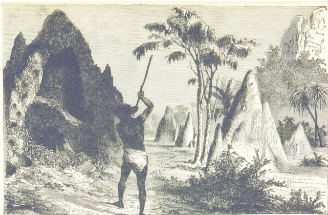
Imagen N°2: Ilustración “Nidos de termitas en África” de H. Drummond, 1891. Disponible en: https://www.flickr.com/photos/british-library/

Inspirarse e imitar a la naturaleza es lo que propone la Biomimética, disciplina de la ciencia que busca soluciones sostenibles, mediante la emulación de modelos y estrategias que han sido desarrolladas y probadas por la naturaleza a través de su evolución y adaptación. Millones de años antes de que los primeros conceptos arquitectónicos del homo sapiens iniciaran su evolución, ya habían animales arquitectos sobre la tierra (Pallasmaa, 2020), estos han descubierto lo que funciona, lo que es apropiado y, lo más importante, lo que perdura en la Tierra. En la Biomimética, la naturaleza es el modelo y el mentor para la generación no solo de soluciones innovadoras a nuestros problemas, sino también para la conservación de la biodiversidad de nuestro entorno (Benyus, 1997).