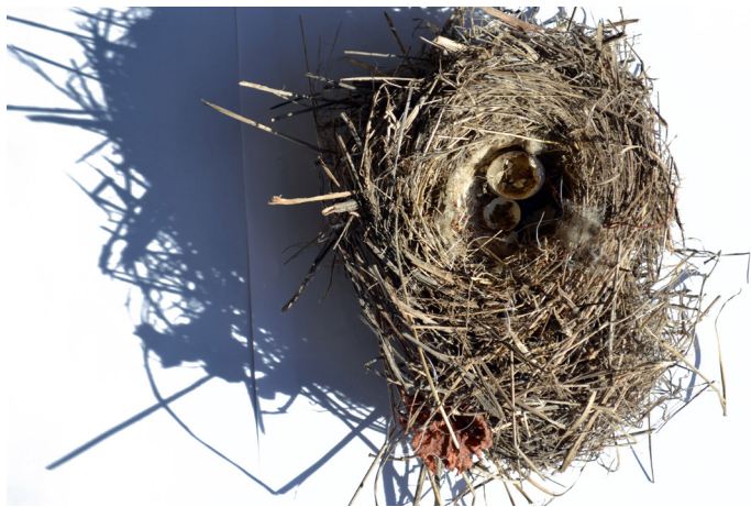
Imagen N°4: Nido de Chincol.

Aunque este tipo de metodologías son experimentales y presentan un alto nivel de incertidumbre, son ideales para contextos educativos como el de la arquitectura y el diseño, que actualmente están buscando promover activamente aprendizajes inspirados en modelos de colaboración y producción de conocimientos interdisciplinarios (Urdinola-Serna, 2018).