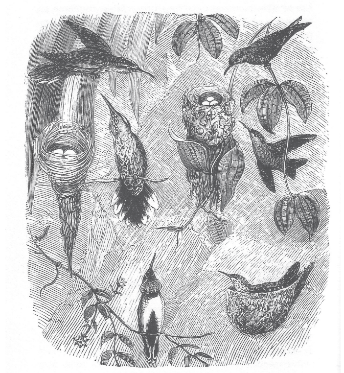
Imagen N°1: Ilustración “Nido de colibrí” W. F. Keyl y E. Smith. Fuente: Juhani Pallasmaa, Animales Arquitectos , 2020.

Actualmente, la profesión del arquitecto está experimentando cambios importantes. Hemos tenido que adaptarnos a demandas sociales, tecnológicas y productivas emergentes. Es por ello que la formación de los futuros arquitectos y arquitectas, y en especial lo aprendido en el taller de arquitectura, debiese responder activamente a un modelo educativo, con métodos de enseñanza-aprendizaje que aseguren en el alumno la capacidad de anticiparse a contextos sociales, económicos y ambientales cada vez más complejos y desfavorables climáticamente.