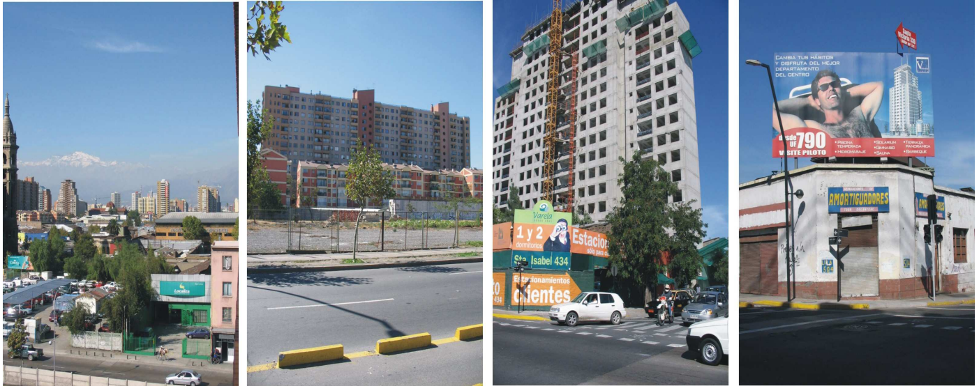
En las imágenes se muestra la publicidad inmobiliaria en la Avenida Santa Isabel, zona sur de la comuna de Santiago.

zonas urbanas que serían "funcionales" a dichos ciclos. Este caso podría considerarse como un ícono de un fracaso temprano de la inversión inmobiliaria, el proyecto Almagro (fig.1, 2 y 3). Cabe mencionar también en este mismo caso que no sólo se genera la desvalorización de la zona urbana, sino que también se presentan otros fenómenos ligados a la ocupación eventual precaria que genera esta desvalorización. Estas alteraciones se sitúan en el margen que deja la acumulación de capital, donde la producción espacial deja un espacio a lo eventual, que en este caso se materializa en la apropiación de un terreno baldío. En las fotografías se aprecia las formas de construcción de imaginarios urbanos desde los dispositivos publicitarios y la evidente contradicción entre una nueva manera de vivir en la ciudad y el soporte físico donde se implanta.