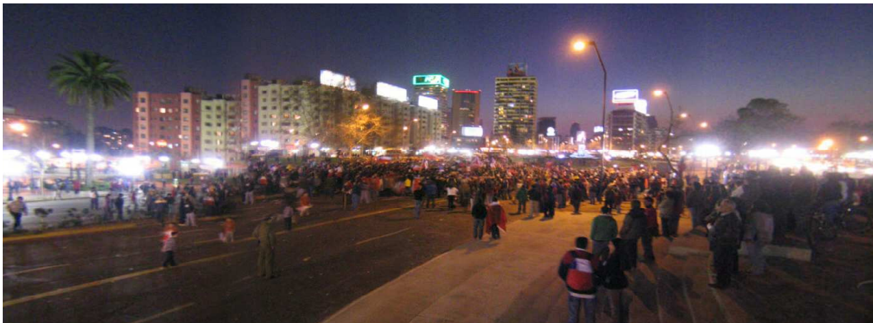
Multitudes. Celebración en Plaza Italia.

Por otro lado coexiste, otra cartografía, la de la ciudad de lo que Lefebvre llamó, el tercer espacio, aquel de las representaciones urbanas, que Soja definió, quizás más certeramente como, espacio vivido 8 . Aquella ciudad que opera con intensidades diversas, desde la densidad de lo cotidiano a la irrupción de lo multitudinario. Un Santiago que aflora desde lo popular y lo masivo; desde las múltiples caras de la subjetividad. Ciudades que se constituyen como territorios de lo informal; en constante desencuentro o conflicto con la concepción y las prácticas espaciales institucionales. Se constituye de estéticas particulares, de Identidades dinámicas y complejas, de apropiaciones y resignificaciones. Desde las manifestaciones multitudinarias en el centro simbólico de Santiago, a las apropiaciones del comercio informal y las estéticas de las tribus urbanas. Todas ellas constituyen sin duda, una 'nueva narrativa' del escenario pos-metropolitano.