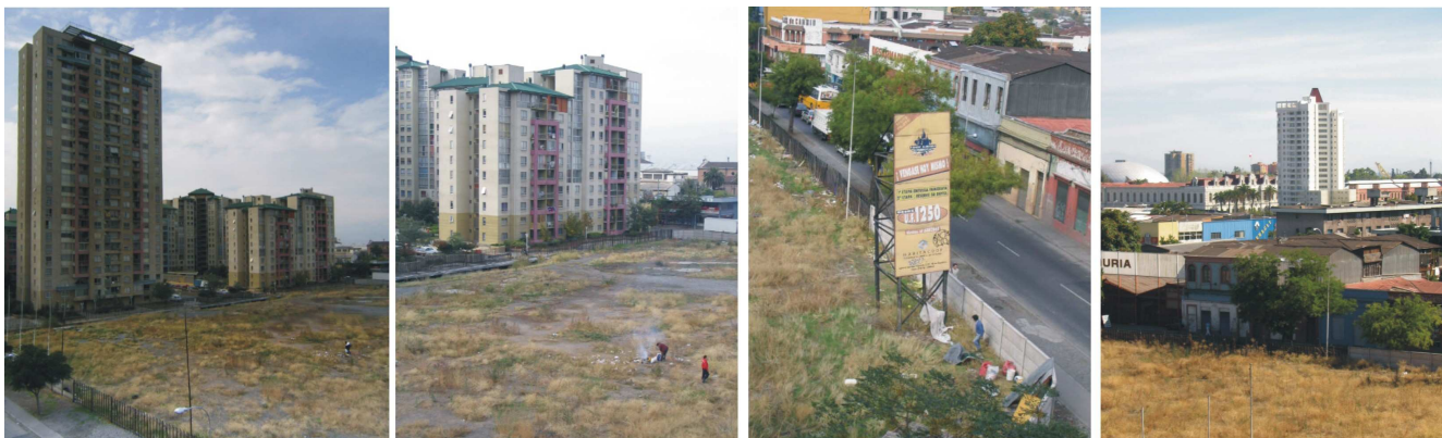
En imágenes se muestra El Conjunto Habitacional Parque Almagro, calles Eyzaguirre y Nataniel Cox (Fig. 1,2 y 3).

La primera cartografía dice relación con los cambios de modelo económico y su correlato en las ciudades. En específico la transformación descrita por Harvey 3 , como el paso del fordismo a la acumulación flexible. Lo que para el caso chileno es la implantación del modelo de liberalismo ortodoxo impuesto desde mediados de los años setenta y que se consolida en la década del 90. En el trabajo directo con la realidad urbana, se logran captar mas claramente dichas acumulaciones, haciendo conexión entre la acumulación de capital y la producción espacial. Creciente cantidad de proyectos inmobiliarios en las zonas principales de la ciudad, operan bajo la dinámica de la especulación inmobiliaria, dejando en segundo plano la preocupación por el desarrollo urbano en su conjunto. En ellos no está sólo en juego la lógica de densificación urbana, que visto de otro modo, involucra la lógica de maximización del uso del suelo urbano, sino también la implantación de un imaginario urbano asociado a la deseabilidad social y a nuevas pautas de habitabilidad impuestas desde los dispositivos publicitarios asociados al capital inmobiliario.