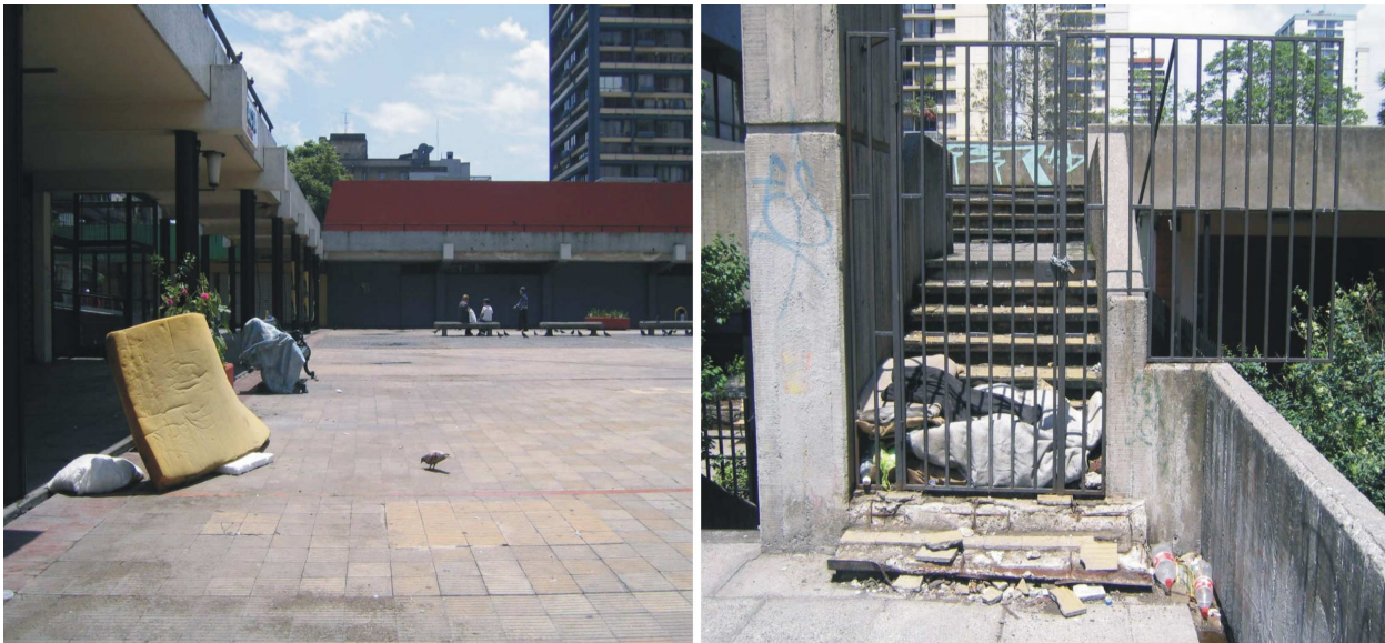
Las imágenes muestran la depreciación material y simbólica del espacio público en un conjunto habitacional representativo del modelo de ciudad del modelo nacional-desarrollista, la Remodelación San Borja

Las siguientes fotografías muestran simplemente como desde la planificación urbana el discurso no hace eco en la ciudad, donde finalmente existe una depreciación de los lugares pensados y diseñados para lo público, convirtiéndolos en residuos urbanos con usos marginales.