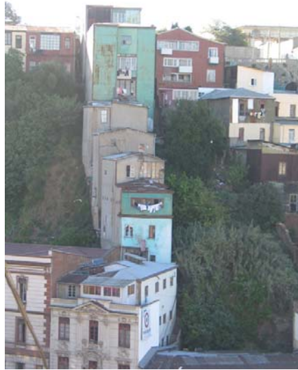
figura n° 5. Valparaíso auto-construye simbólicamente y materialmente, permitiendo sedimentar en sus tectónicas, signos culturales, y la propia entropía de la materia de sus cerros, una mirada particular entre la realidad y la representación de Valparaíso.

diferentes formas de permanecer en los cerros de Valparaíso, transformándolo en una especie de archipiélagos de lenguaje.