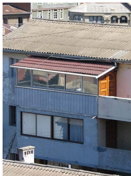
figura n° 4. Esas mismas maneras de configurar y de estructurar esa interioridad de lo social expuesta en paisaje, construyen las condiciones de lo social y sus tipologías en