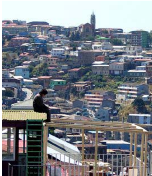
figura n° 17. Imagen del autor. Valparaíso como pura exterioridad desplegada, Valparaíso es un umbral del lenguaje, donde la escritura de sus huellas sobre la geografía y su cota, demarca un espacio de la memoria donde no hay olvido, por que no hay recuerdo igual a otro, es la memoria de lo que la palabra esta aun siempre por decir, es rumor de limites

figura n° 16. Imagen de Autor. Sin embargo en nuestro paisaje cotidiano en Valparaíso cuando nos vemos enfrentado sobre todo a las apropiaciones y resignificaciones del sujeto sobre su espacio publico, o su espacio privado, en ¿que residirá la potencia de la materia en Valparaíso?