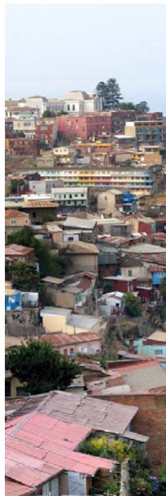
figura n° 8. El habitante de Valparaíso como intérprete y su contexto territorial construiría un paisaje local, su paisaje, que relacionaría ese entretejido de cualidades y notaciones que son imposibles de evitar desde el espacio geográfico y la dimensión cultural del territorio, que surgiría desde la visión del intérprete sobre el contexto