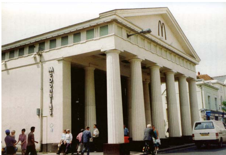
figura nº 8. VVAA. Diccionario METAPOLIS Arquitectura Avanzada. Ed ACTAR Barcelona 2001. las reflexiones sobre las travesías de la comunicación de la cultura y su representación del espacio

figura nº 7. VVAA. Diccionario METAPOLIS Arquitectura Avanzada. Ed ACTAR Barcelona 2001. el espacio y sus objetos se transformaron en micro-objetos de estudio dejando en claro que la organización del espacio es un producto social.