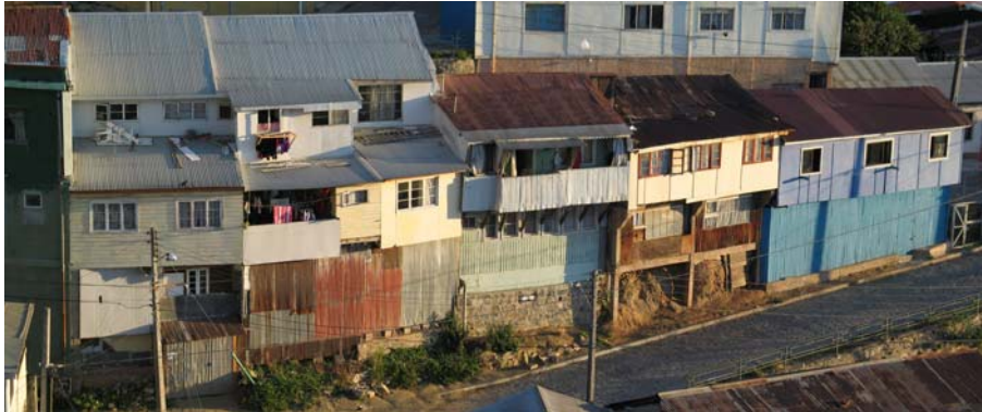
figura n° 11. Imagen del Autor. Después de conocer las construcciones en los faldeos de Valparaíso, se que mis estudios y experiencias no me sirven de nada... Cita de Guillermo Quiñónez.

figura n° 10 DILLER+SCOFIDIO_vice-virtue glasses fountain 1997. El espacio y su materialidad registra el fin de la representación moderna y la exposición a la intemperie del signo urbano como pura exterioridad desplegada.