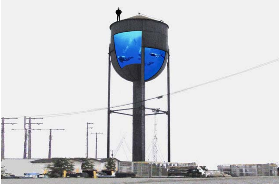
figura n° 9. ARCH'IT files_SportcitylaN+hipercatalunya Barcelona 2003. Estos espacios nuevos de lo múltiple e interactuante, ya no se alojaban sobre análisis o estudios acotados sobre una tipo de lógica cuantitativa sino que se hospedan hoy sobre biografías, materialidades residuales, márgenes e insubordinaciones culturales

en lo cotidiano son un ejemplo de las construcciones de los estudios culturales y los campos híbridos de la identidad