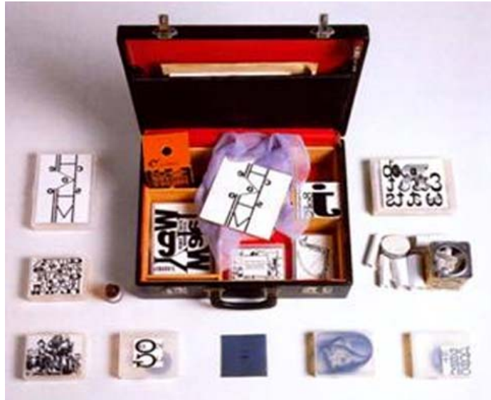
figura nº 7. VVAA. Diccionario METAPOLIS Arquitectura Avanzada. Ed ACTAR Barcelona 2001. el espacio y sus objetos se transformaron en micro-objetos de estudio dejando en claro que la organización del espacio es un producto social.

figura nº 6. Crossed Lines: New Territories of Design. Ed ACTAR Barcelona 2001. El espacio llega a plegarse a través de las re-formulaciones espaciales y temáticas de este trabajo sobre el GIRO ESPACIAL.