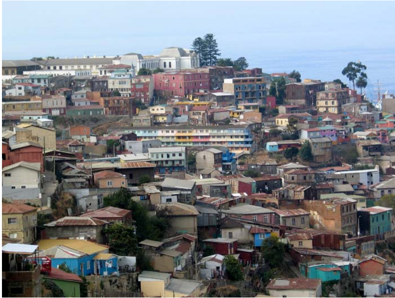
figura n° 1. Las formas de atribuirse una ciudad pasan por la condición INSITU de nuestra experiencia sobre ella