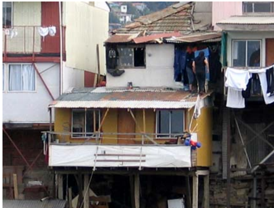
figura n° 15. Imagen del Autor. La escena de Valparaíso es el lugar del relato y las representaciones donde emerge el sujeto y su red de relaciones, transformándolo en actor. La comunicación logra articular espacios, y en la convivencia dialógica y la operatividad de la cronotopía construyen territorios donde las fronteras entre lo real y lo imaginario apenas constituye un aspecto diferencial de los sentidos que dan forma a nuestro itinerario vital y a sus relatos de vida

figura n° 14. imagen del Autor. Valparaíso era un depósito de identidades nítidas que se fueron integrando al marco de referencias geográficas que a su vez se fueron diluyendo dentro del espacio de encuentro y exponiendo a la experiencia como una portadora de la evidencia.