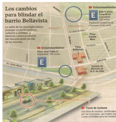
Intervención en calle Pío Nono, Barrio Bellavista.

localizaciones en zonas periféricas y alejadas de las zonas consolidadas (la ciudad difusa) donde no se cuenta con servicios e infraestructura.