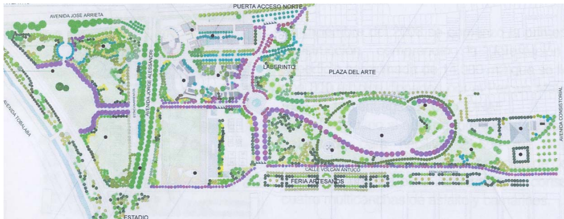
Parque Urbano de Peñalolén

En materia de infraestructura resaltan los proyectos de ciclovías, demanda muy sentida por la comunidad. Sin dejar de reconocer la necesidad de contar con un plan general de ciclovías que actúe de manera más activa, los proyectos estudiados aportan a este fin incorporando además trazados que ponen en valor espacios públicos y áreas verdes comunales. Así, la propuesta de la comuna de La Reina se desarrolla junto al Canal San Carlos permitiendo darle a este espacio verde un programa que le confiere mayor uso y seguridad constituyéndose en un detonante y punto de partida para la transformación de los barrios cercanos.