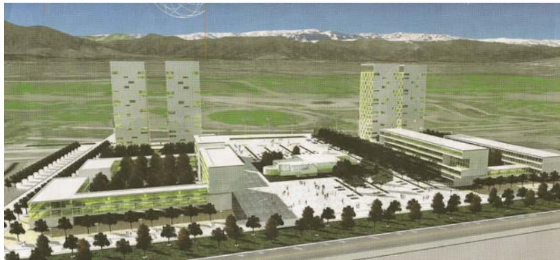
Imagen objetivo de la Ciudad Parque Bicentenario, comuna de Cerrillos.

espacio público y de tipologías arquitectónicas, hacen necesario desarrollar una previsualización de la propuesta (imagen-objetivo) que permita su evaluación por las autoridades, la comunidad y de demás actores participantes.