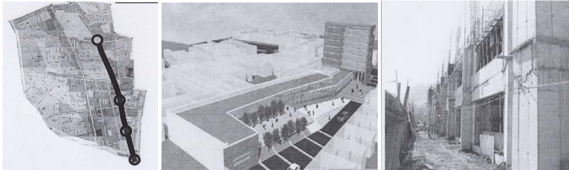
Centro Cívico comuna de Independencia.

Los centros cívicos conforman el principal espacio público de las comunas, son las plazas públicas por excelencia y el principal espacio de expresión del gobierno local. Sin embargo, estas funciones en varias comunas funcionan de manera disgregada y sus dependencias se han debido ubicar en casas antiguas que no resultan apropiadas para estos fines ni conforman una esfera pública local de calidad. Varias son las comunas que se encuentran construyendo su centro cívico como Peñalolén, Recoleta e Independencia.