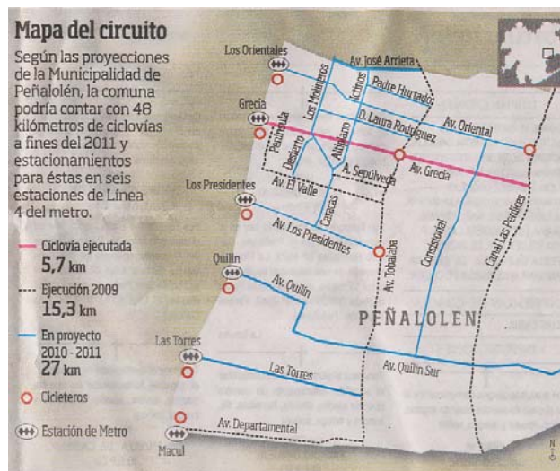
Red de ciclovías comuna de Peñalolén.

En materia de infraestructura resaltan los proyectos de ciclovías, demanda muy sentida por la comunidad. Sin dejar de reconocer la necesidad de contar con un plan general de ciclovías que actúe de manera más activa, los proyectos estudiados aportan a este fin incorporando además trazados que ponen en valor espacios públicos y áreas verdes comunales. Así, la propuesta de la comuna de La Reina se desarrolla junto al Canal San Carlos permitiendo darle a este espacio verde un programa que le confiere mayor uso y seguridad constituyéndose en un detonante y punto de partida para la transformación de los barrios cercanos.