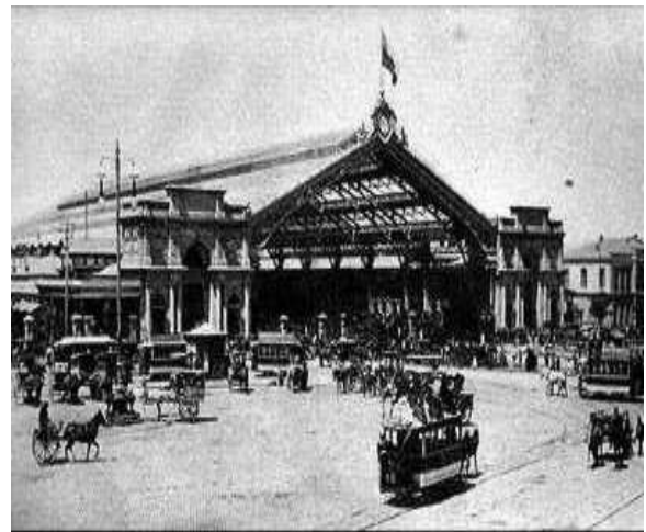
Tranvías de Santiago en la Estación Central.