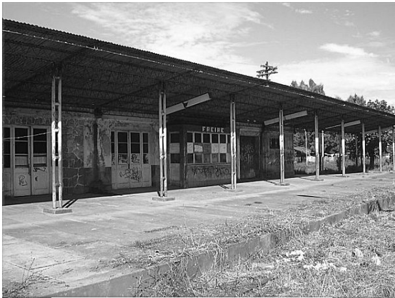
Edificio estación Freire