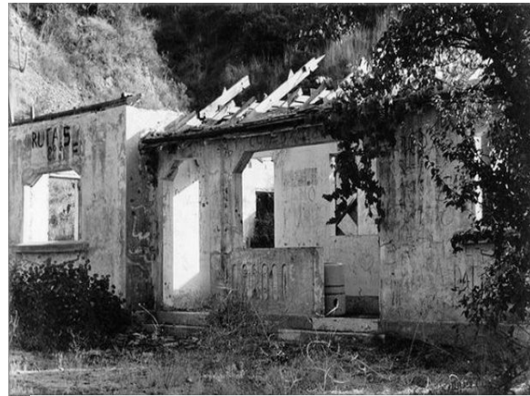
Edificio estación Palos Quemados