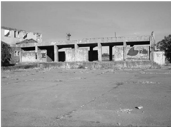
Estación de ferrocarriles Angol Situación actual