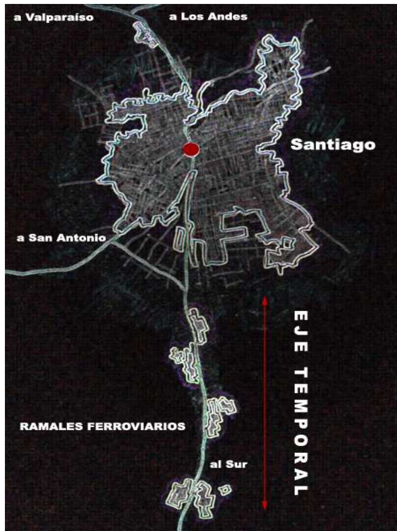
8 Fig.1. Esquema territorial.