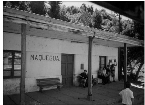
Andén estación rural de Maquegua ramal a Constitución