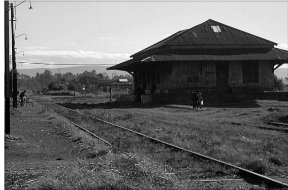
Edificio estación Pitruquén