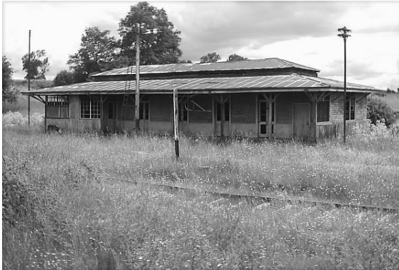
Edificio estación de Quino

Muchas de las estaciones ferroviarias de los ramales se encuentran completamente abandonadas, sin embargo se mantienen en la memoria colectiva de cada uno de los habitantes que ocuparon el ferrocarril en su tiempo de esplendor. Los vestigios de algunas estaciones no tienen uso ni reutilizaciones programáticas, y en términos prácticos se transforman en espacios residuales ocupados por uno que otro vagabundo de turno, a pesar de la importancia como imagen e innegable condición de referente para la población de los pequeños pueblos.