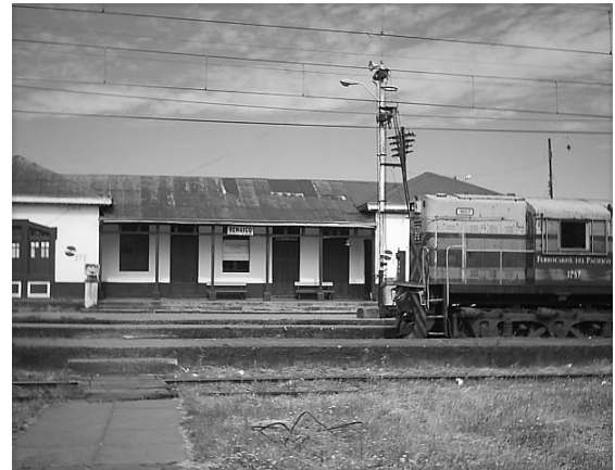
Estación de ferrocarriles Renaico Situación actual ramal a Traiguén 1