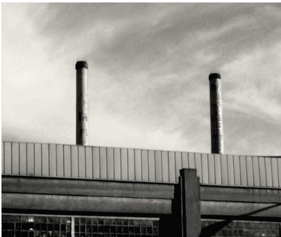
Yarur Sumar, icono de la industria textil, hoy en desuso.

La presencia lárca ya no se circunscribe a un contexto necesariamente rural, ni provinciano, sino más bien a todo lugar que constituya una manifiesta relación espacio-temporal en términos de una configuración mítica. Si bien el poeta lárca huye de la ciudad en respuesta a su función modernizante, a la vez busca en ella elementos que permitan desentrañar una imagen poética a través de la nostalgia. Aunque haremos hincapié en su manifestación provinciana no podemos dejar de señalar el ámbito citadino de la cosmovisión lárca y su expresión a partir de los vestigios del capitalismo en la composición urbana.