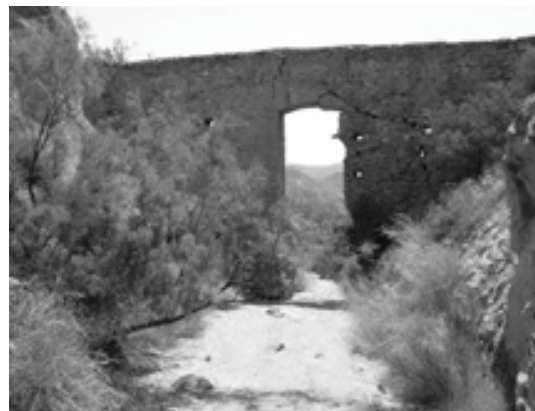
Puente de pequeña cimbra