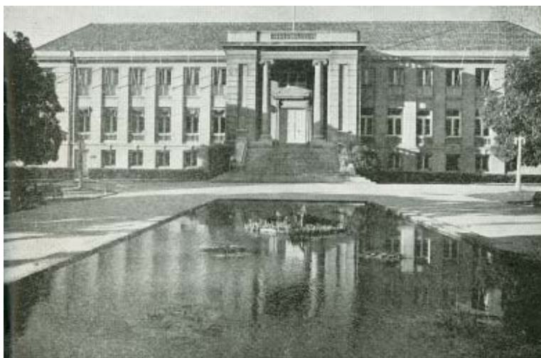
Imagen 2. Casa Consistorial. Diego Muñoz, Villa de Ñuñoa , op. cit., p. 19.