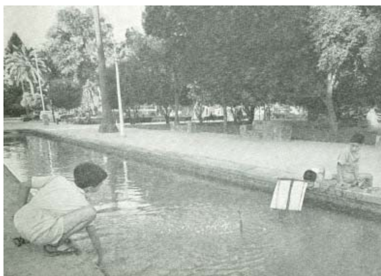
Imagen 3. Uso cotidiano de la Plaza Ñuñoa. Diego Muñoz, Villa de Ñuñoa , op. cit., p. 51.

Pocos años después -entre 1969 y 1970- y mientras los grandes proyectos urbanos del ejecutivo se orientaban bajo las directrices de CORMU, la Revista Técnica Municipal dedicó dos números a las que a su entender eran los municipios más progresistas de ese momento: Ñuñoa y Providencia. Me parece que en ellas se veía reflejado lo que entonces era el imaginario de la 'comuna progresista': aquella entidad territorial capaz de integrar diversos grupos sociales, actividades y servicios. Desde luego, un imaginario ligado a lo indicado más arriba: la "ciudad jardín" como artefacto urbano opuesto a la histórica configuración del centro de la ciudad.