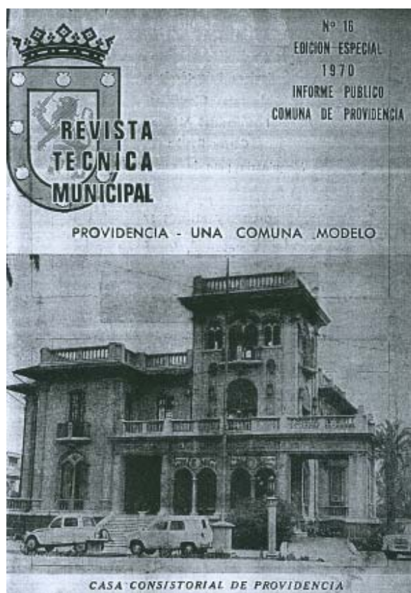
Imagen 4. Palacio Falabella, sede la Municipalidad de Providencia Revista Técnica Municipal N° 16, 1970.

“Según el juicio de numerosas personalidades como sociólogos, urbanistas, economistas y profesionales especializados, el progreso que registra Providencia en todos los planos la colocan en un superior nivel que le confiere la calidad de ‘Comuna Tipo’, es decir como un exponente destacado que puede servir de ejemplo y modelo, por cuanto sus adelantos y organización son susceptibles de ser aplicados integralmente en otras Comunas [...]” 17 .