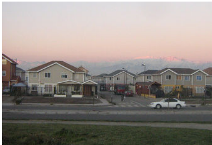
Fig.5 Gated Community en la comuna de Maipu, Santiago de Chile

Por un lado, las gated communities o comunidades cerradas han sido la respuesta de la arquitectura inmobiliaria para facilitar el cambio de destino del suelo, principalmente porque crea una discontinuidad en el espacio urbano, necesaria por otra parte si los habitantes de estas exclusivas zonas residenciales quieren evitar los 'peligros' que les rodean, al estar aislados en zonas marginales. El miedo, por tanto, ha favorecido estos enclaves, cuyos usos y servicios están destinados únicamente al uso exclusivo de sus residentes convirtiéndose en lo que Mike Davis llama 'archipiélagos carcelarios' es decir la transformación de la ciudad en una sucesión de islas fortificadas dentro de un espacio urbano fragmentado, donde la lucha por el territorio está convenciendo a los más afortunados de la necesidad de proteger sus espacios vitales (domésticos y públicos) con muros, vallas, guardas de seguridad o cámaras de vigilancia. Evidentemente estas comunidades se insertan en el tejido urbano negando la ciudad real, evitando ésta como espacio de conflicto y diálogo, e imponiendo una ciudad homogénea, controlada y compuesta por iguales ya que la aparición del 'otro' supone un peligro. Así, se convierten en guetos de riqueza deseosos de felicidad que buscan en el New Urbanism la recuperación de un pasado urbano mítico como lugar de comunión con los iguales. (Fig.5)