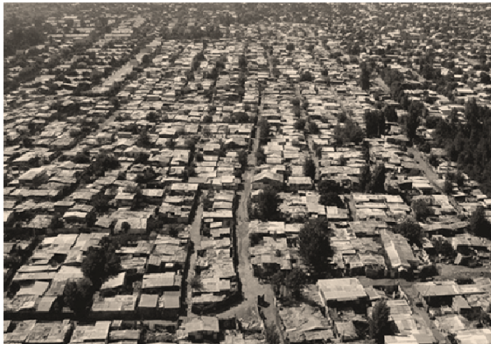
Fig.3 Terrenos de la 'toma' de Peñalolen.

planes de la Administración del presidente Eduardo Frei, limitada por la escasez de recursos económicos públicos frente a la demanda popular. Así, entre 1960 y 1970, durante la campaña electoral, se realizaron numerosas 'tomas' de terrenos promovidas y apoyadas por organizaciones de distinto signo político. Estas 'tomas' o campamentos "aportaban al urbanismo de la ciudad una intención por sociabilizar las actividades vecinales y la generación de nuevas formas de producción de la vivienda y mediante ellas, se retoman las formas urbanas de una arquitectura provinciana, presentes en su memoria de emigrantes de campo... El poblador, se instala en la ciudad en un entorno semirural y busca trabajo en ella para procurarse un ingreso que él cree le ofrece la vida urbana 7 ". Sin embargo, su simpleza geométrica para facilitar la distribución por lotes y evitar conflictos, impide una integración armónica en la trama urbana existente, permitiendo un intercambio social en la calle y doméstico en las viviendas, pero con una conectividad nula con la ciudad adyacente. (Fig.3)