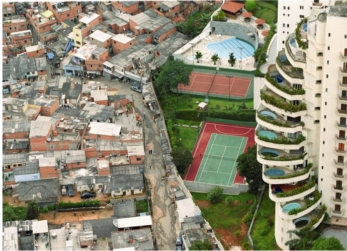
Fig. 1 Favela Paraisópolis. Sao Paulo, Brasil.

islas emergentes en un océano autoconstruido desde la miseria. Estos asentamientos reciben diferentes nombres según la región: favelas en Brasil, villas miseria en Argentina, callampas en Chile,... pero todas ellas aluden al mismo fenómeno, barriadas de infravivienda que rodean las grandes metrópolis de los países en vías de desarrollo. Así, en un límite tan difuso como marcado, se encuentran estas dos ciudades, la formal y la informal, la legal y la ilegal, donde en el mismo espacio urbano se enfrentan la exclusión y el desamparo de unos frente a los privilegios de otros. (Fig.1)