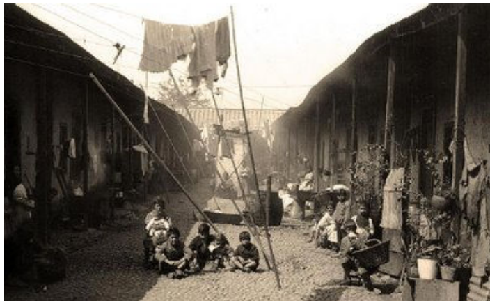
Fig.2 Conventillo del sector Brasil. Fotografía Archivo Chilectra, 1920.

Durante las primeras décadas del siglo XX, la clase obrera vivía en la miseria y la clase media, formada por pequeños empleados ocultaba su precariedad y angustia tras las puertas cerradas de sus casas. En 1910, el diario El Mercurio publicó que sólo en la ciudad de Santiago más de 100.000 personas habitaban conventillos. (Fig.2)