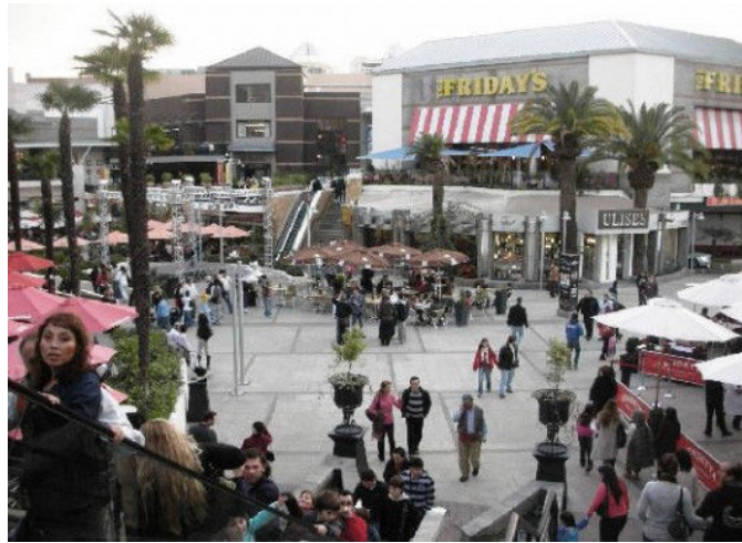
Fig.6 Mall Parque Arauco, Santiago de Chile.

Ambos procesos, domésticos y de ocio, son producidos de esta manera en la ciudad contemporánea porque la frontera que separa lo público de lo privado es imprecisa. En la ciudad formal, el miedo va reduciendo radicalmente la vida en el espacio público, anulándolo casi por completo y la vida se desarrolla en el ámbito doméstico, en lo privado. Por el contrario, en la ciudad informal, la calidad de los espacios domésticos es tan pobre y deteriorada, que sus habitantes se ven en la necesidad de vivir en el espacio público la mayor parte del tiempo. Ambas formas de relación social y escenificación sobre el espacio urbano están incompletas por lo que la relación entre ellas es esencial para desdibujar los límites de la ciudad fragmentada. Es mediante el conflicto que se produce en el contacto entre ambas, donde reside la verdadera vida urbana.